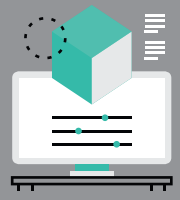
Maîtrise de toute la chaîne numérique